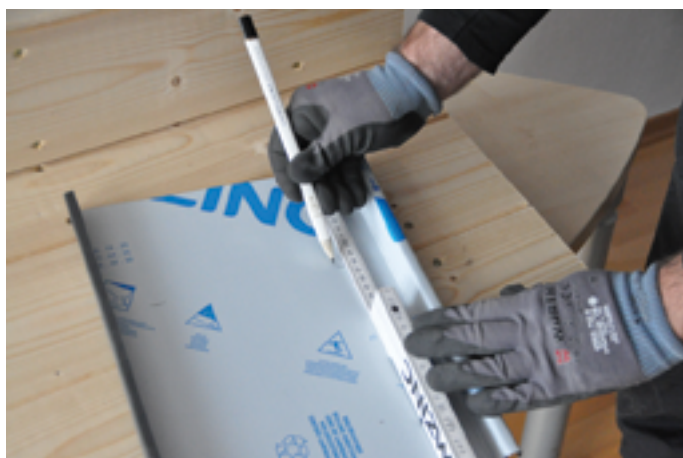
Anzeichnen der Kantlinie, Dachschräge Übergang zur Senkrechten