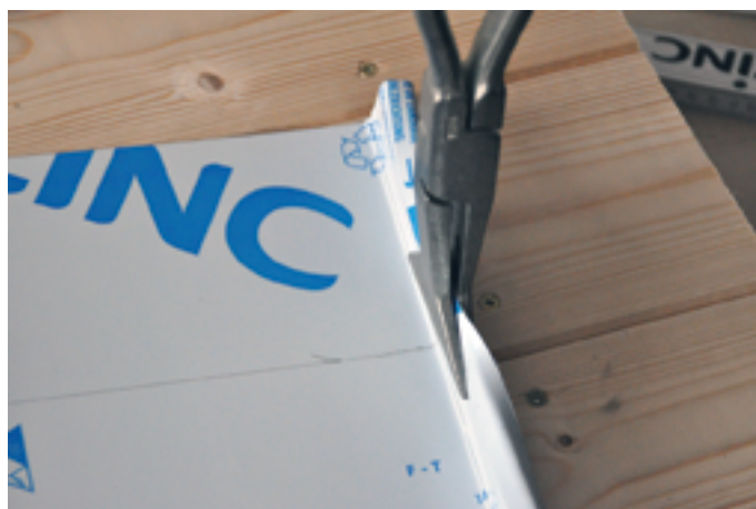
Aufkanten des Stehfalzes