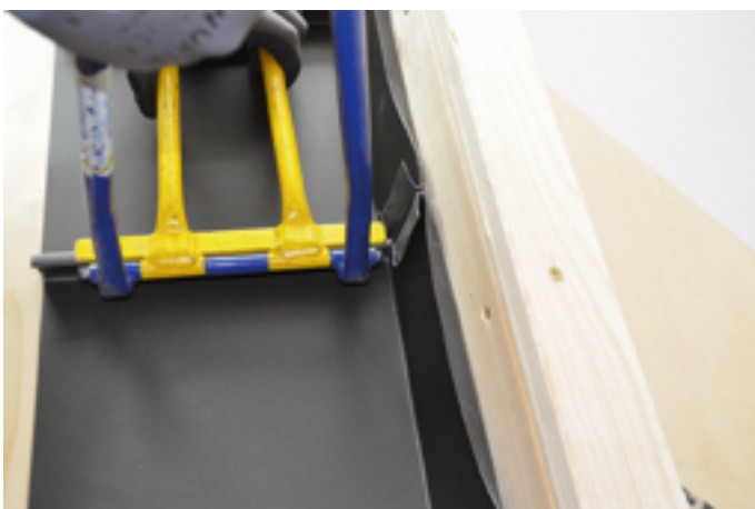
Schließen des Falzes