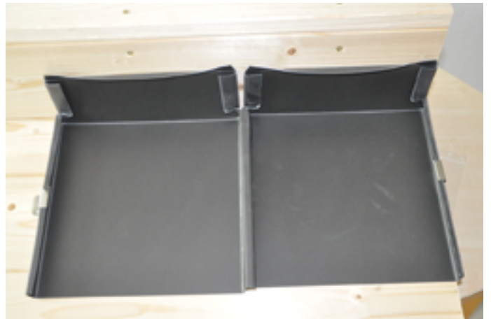
Vorbereitete Scharen am Firstaufgang