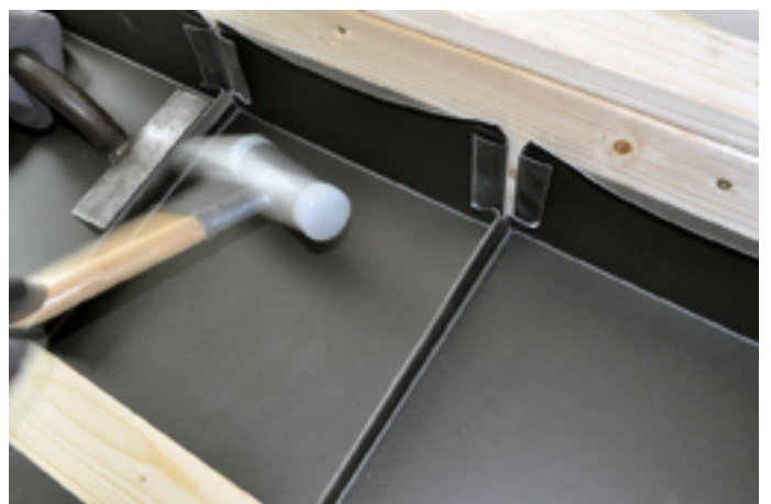
Schließen zum Doppelstehfalz