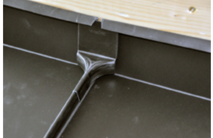
Wasserfalz wieder zurückkanten