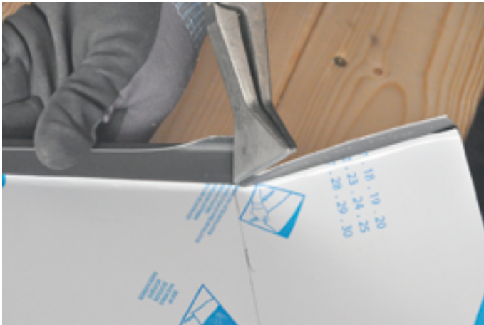
Herstellen der Quetschfalten