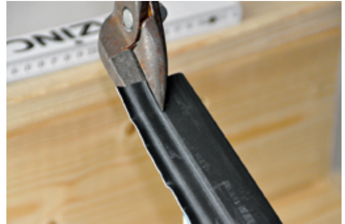
Zurückschneiden des Ober- und Unterfalzes