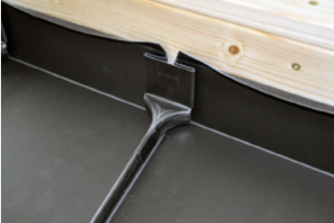
Aufschieben der Firstanschlusskappe